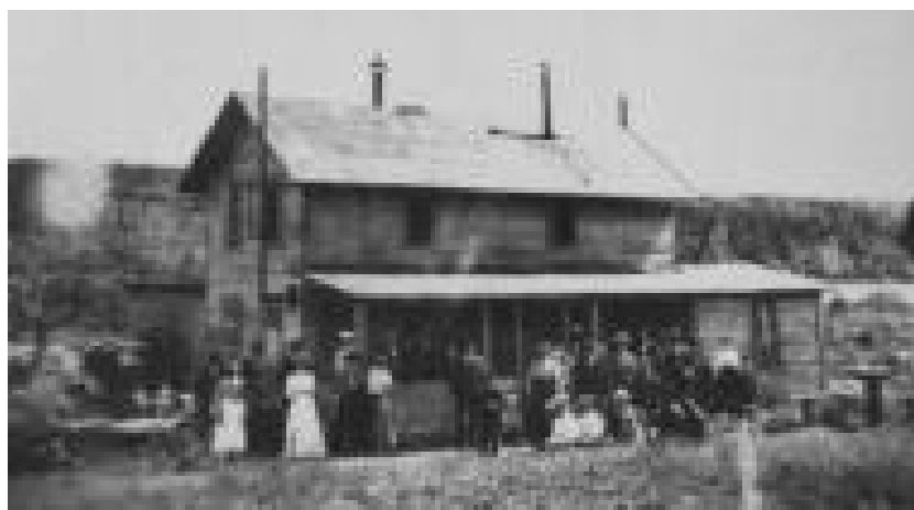
Badhuset vid " Klara Källa "

På sjösystemet, varav Kväggen och Hyttälven är en del, bedrevs under "hyttiden" och ända fram till 1940-talet omfattande båttrafik. Båtar användes som transportmedel för leveranser från den torvströfabrik som fanns under åren 1905—1935 vid Kväggen. Likaså användes ångbåtar för transporter till och från sågverket vid Kväggen. Dessa användes också av bygdens folk för persontrafik vid utflykter och beställningstrafik